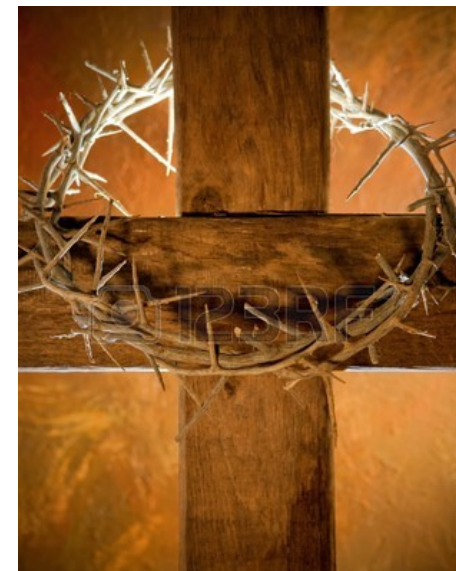
Basilika Lichen (Polen)