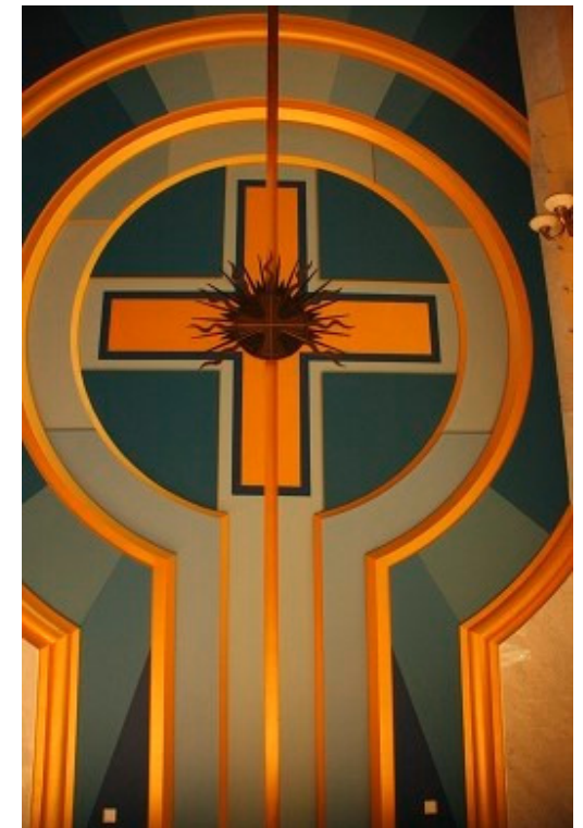
Basilika Lichen (Polen)

Die Gebetszeiten der Schwestern werden separat bekannt gegeben.